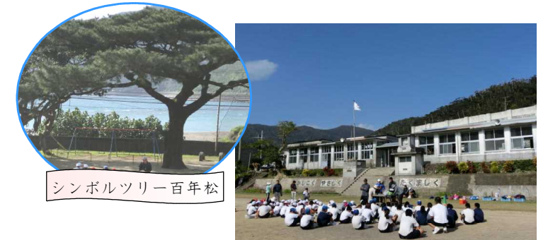
シンボルツリー百年松