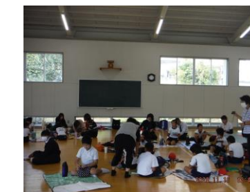
古仁屋高校にて昼食