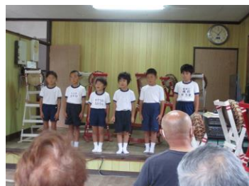
はじめのあいさつ

11月11日(土)の土曜授業の日に、伊須公民館にて『出前学習発表会』を開催しました。たくさんの方々にご来場いただきました。温かい声援や拍手もあり、子ども達も嬉しそうでした。飲み物等の差し入れもありがとうございました。また、道具等の運搬に多くの保護者のお手伝いをいただきました。ありがとうございました。