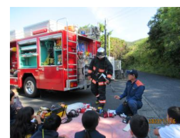
瀬戸内消防分署にて