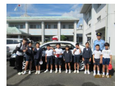
瀬戸内警察署にて