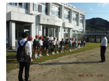
嘉鉄校での出発式