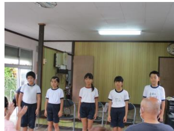
おわりのあいさつ