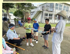
【高学年が塩分補給を呼びかけました】

いよいよ運動会が近づいてきました。いつもは、仲良しの子ども達ですが、赤組と白組に別れた途端、赤組 VS 白組の闘志が沸いてきて「絶対に負けらんどー」の目つきに変わります。今日練習したリレーは、白組が少し早かったです。さて、運動会はどうなるでしょう。是非、学校へ足を運んで一緒に楽しみましょう。お待ちしております。