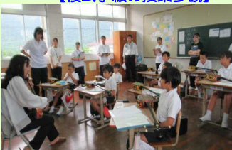
【姫夏先輩の三味線教室】

複式学級の授業や地域と連携した授業、学校の先輩と一緒に授業など嘉鉄小ならではの特色ある活動を参観してもらいました。どの学生も表情が明るく、子どもに積極的に関わる姿を見て、「夢を叶えるべく一生懸命勉強してください。皆さんとまた学校で再会したいです」とエールを送りました。