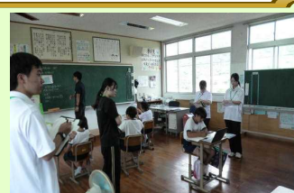
【複式学級の授業参観】

9月5日、鹿児島大学教育学部の学生さんが10人学校観察実習で来校しました。大学は、まだ夏休み中ですが、離島の学校の様子を学びたいと大学の募集に応募したそうです。