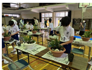
ものづくりマイスター