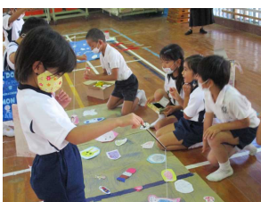
生活科フェスティバル