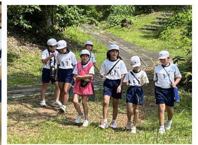
【1日目:クイズウォークラリー】