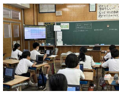
6年: ロイノートによる意見の共有や確認

GIGAスクール構想による一人一台端末が整備されて以降、本校でもICTを活用した授業づくりを進めてきました。全学年でAIドリルによる学習定着に活用したり、本校が研究を進めている「山場の工夫(友達と意見を交流する等)」で活用したりしています。職員間でも、どのような活用が効果的であるかを研修しています。夏休みには家にそれぞれ持ち帰って復習や調べ学習に活用した児童もおりました。「日常的な文房具」の位置づけになることを目標としております。手書きや具体的な操作をする学習とうまく組み合わせ、児童が主体的に学びを深められるように、指導してまいります。