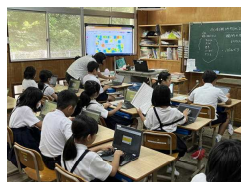
3年: GoogleJamboardによる意見交流