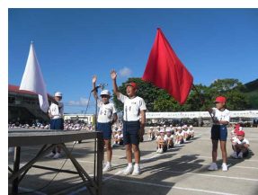
【団長による選手宣誓】

10月5日(日)に第78回運動会を行いました。当日は、天候にも恵まれ、子どもたちは練習の成果を存分に発揮することができました。応援に来てくださった保護者や地域の皆様、運営面で支えてくださったPTAの皆様、どうもありがとうございました。