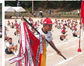
【優勝は赤組でした】