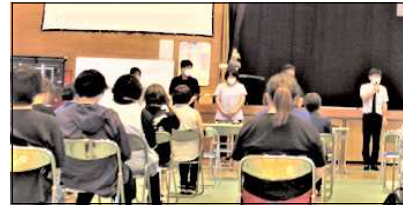
【↑PTA総会 新役員紹介・挨拶】