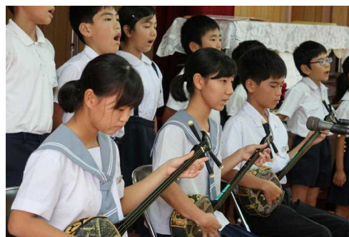
☆篠川校の特色ある活動☆