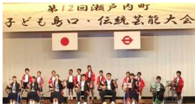
☆篠川校の特色ある活動☆ 「島唄・三味線発表」