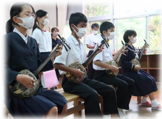
☆特色ある教育活動☆